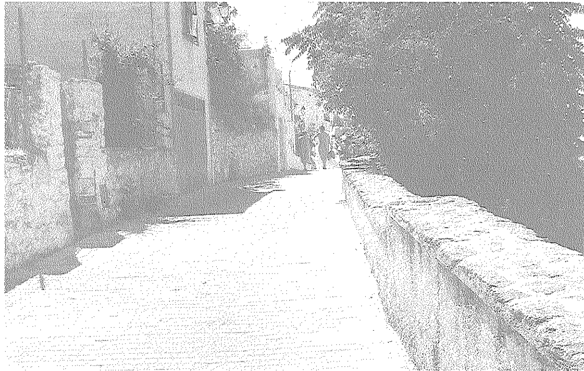
ASPECTO. Una de las calles del barrio de las Cruces que tendrán actuaciones urbanísticas. /s. c.

La finalidad última es perseguir en ambos barrios un desarrollo urbano sostenible. Una reunión celebrada a principios del año 2008 sirvió al Ayuntamiento para presentar e implicar en este proyecto a los diferentes colectivos alcalaínos. A la misma asistieron representantes de las asociacio-