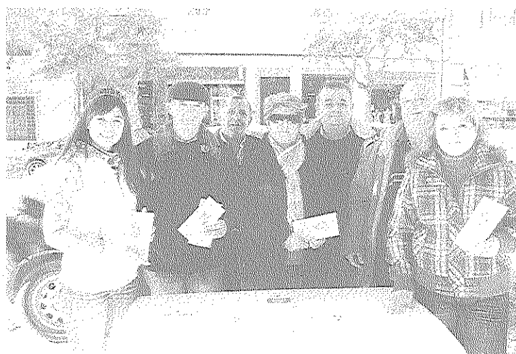
INFORMACIÓN. Explicación de las terapias. /s. c.

Centro de Atención de Averías: 902-516-516 Centro de Atención Comercial: 902-509-509