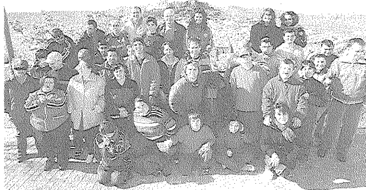
AYUDAS. Componentes de la asociación Los Amigos. /s. c.

tará una única subvención por colectivo y deben estar suscritas por los presidentes de dichas asociaciones y colectivos o por los alcaldes pedáneos de cada aldea. Asimismo las asociaciones han de presentar sus estatutos debidamente actualizados, con el CIF de la persona en representación del colectivo.