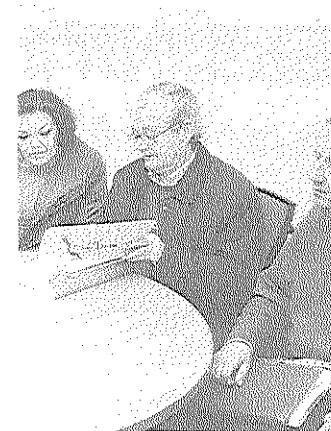
AMIGOS. Cultura. /s. c.

subvenciones se encuentran, entre otros: alcance social en cuanto a número de participantes y colectivos a los que se implica, temporalidad y duración de la citada actividad, nivel de participación financiera y técnica, nivel de repercusión de la actividad, así como disfrute general de la ciudadanía.